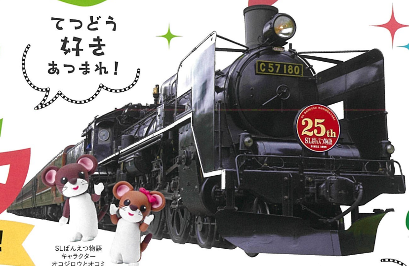
SLばんえつ物語 キャラクター オコジロウとオコミ